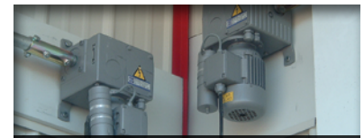
Réducteur pour arbre d'entraînement