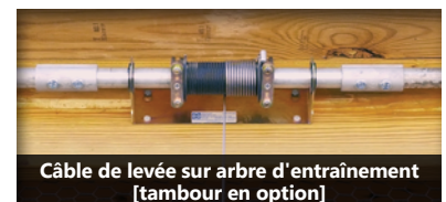
Câble de levée sur arbre d'entraînement [tambour en option]