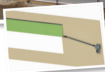
TOILE ROLL-UP SIMPLE ▶